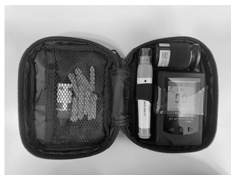
그림 1. Finger tip lactate measurement device set

젖산 측정은 0.3에서 25.0 mmol/L 까지 측정이 가능한 Lactate plus(NOVA biomedical, Germany) model(그림 1)을 사용하였으며, 실험실 젖산 측정기구와 매우 높은 상관관계( r=.997 , p<.05 )를 보였다(Clark 등, 1984). 젖산을 측정하기 전 control solution test로, calibration을 진행하였으며, 이는