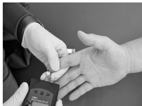
그림 2. Finger tip lactate measurement

주 1회 시행되었다. Puncture site는 환자가 원하는 손의 2, 3번째 손가락 끝이었으며, Disposable FA Eolswab(진선메디칼; Korea) 으로 닦아내고 말렸다. Auto-Lancet을 puncture site에 대고, 버튼을 누른 후 첫 번째 핏방울은 clean tissue로 닦아내고, 살짝 손가락을 짜내어 두 번째 핏방울을 취하였다. 핏방울을 test strip에 갖다 대어 test strip이 가득 차면, beep 소리가 나고 13초 후에 기기 화면에 측정치가 나타난다. 젖산 측정은 하루 2번의 운동 중 오후 운동 시 심장재활 담당 간호사가 시행하였다(그림 2).